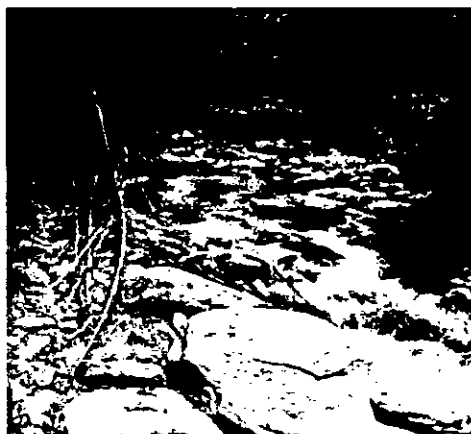
Fotografía 5. Río Rojo