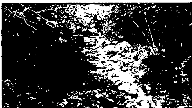
Fotografía 6, 7 y 8. RIO AZUL